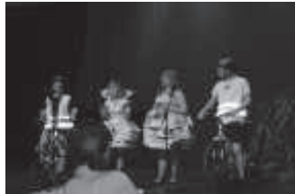
Победа присуждена Куртнаскому молодежному Центру.

В категории «Челая школа» титула удостоена команда Ихвиского любительского кинофестиваля (читатели, наверняка помнят, что там с успехом выступила и наша молодежь). В первой ступени (1-4 классы) лучшим признан проект создания магазина для подержанных книг, созданного в Кивийской средней школе №1. Во второй ступени (5-9 класс) победа присуждена Куртнаскому молодежному Центру за организацию международной встречи с молодежью Польши и Финляндии. В третьей ступени сильнейшим признан проект