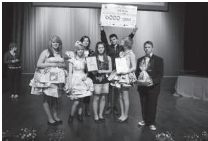
Võit on meie!

Lavaleminek on suursugune. Kuuleme stiilset ja rütmikat muusikat, valgusemärg erinevate värvidega sillerdamas laval ja silmades. Ja seejärel astume aplausi saatel glamuurselt lavale. Rambivalgusesse tõustes on justkui kõik hirm kadunud ja valdavaks saab mugavuse tunne. Kaheksa minutit vuhiseb mööda kui tuul – ja juba ongi see läbi! Lava taga on kõigil naeratus kõrvadeni ja me kallistame üksteist hästi läinud etteaste pärast. Mõelduvad veel mõned tunnid ning kätte jõuab see aeg, mida terve päeva oodanud oleme – võitjate selgumine. Veel