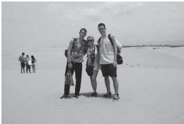
Sakslane, eestlane ja soomlane Coro liivaluidetel.

Aprilli alguses vahetasin ka oma peret, elan nüüd endise vahetusisa õe juures ja lisaks on