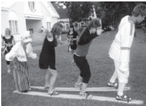
Eesti noorte korraldatud öhtul testiti välismaa sõprade võimeid ning pandi kõik suvel suusatama

Ma arvan, et nii mõnigi leidis sealt omale sõbra terveks eluks või isegi armastuse! Eriti toredaks osutus hommikuvõimlemine, mis oli midagi uut kõigile, sest kes ikka viitsib kodus hommikuti üksi võimlemist teha. Koos on palju huvitavam,