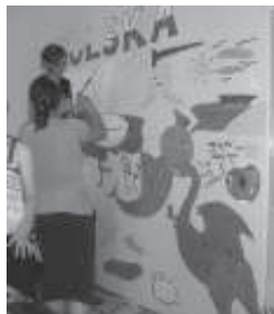
Kõigi kolme riigi noored jätsid laagri viimasel päeval Kurtna noortekeskuse seinale endast jälje maalides sinna pildi, mis just nende kodumaad kõige rohkem iseloomustab