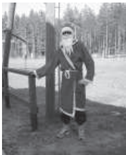
Öhtuti tutvustas iga riik enda kodumaad. Soomlased olid kaasa toonud „ehtsa“ jõuluvana Lapimaalt.

lõbusam ja ka nalja saab rohkem. Ja nii need päevad möödusidki seigeldes, matkates ja suheldes, kuni jõudis kätte see hetk, mil pidi kodudesse naasma. Emotsioone oli palju – oli neid, kes kurvastasid lahkimise pärast, kuid jagus neidki,