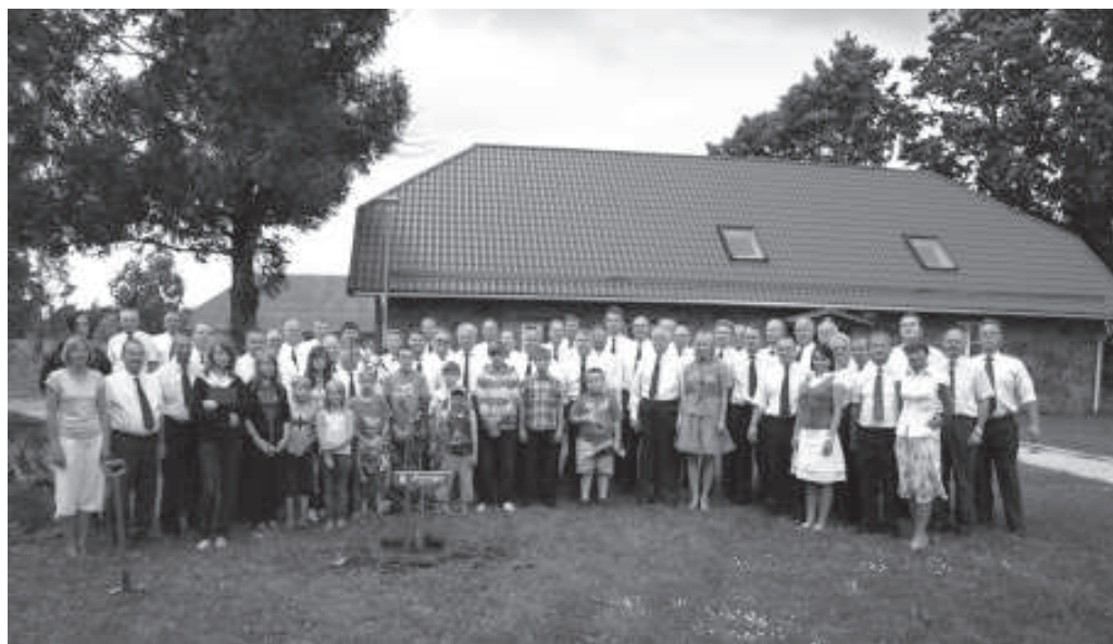
SL Forestalia meeskoor, nende pereliikmed ning mõisapargis uue elupaiga leidnud tammeppu

26.-31. juulini oli Illuka mõisasüda lauluhällest tulvil – metsameeste koor Forestalia korraldas oma tänavusuvise laululaagri just sinne pargi rüpes. Traditsiooni kohaselt heisati esimesel öhtul laagri lipp ning viimasel päeval anti (ettearvatult täissaalile) emotsionaalne kontsert; eelviimasel päeval aga istutati mõisaparki lisaks veel üks tammeppu. Lahkudes tödesid mõlemad osapooled – nii osalejad kui võõrustajad – et seljataha jäi igati tegus ja kordaläinud nädal ning et Forestalia meeskoorile on Illuka mõisa uksed alati avatud.