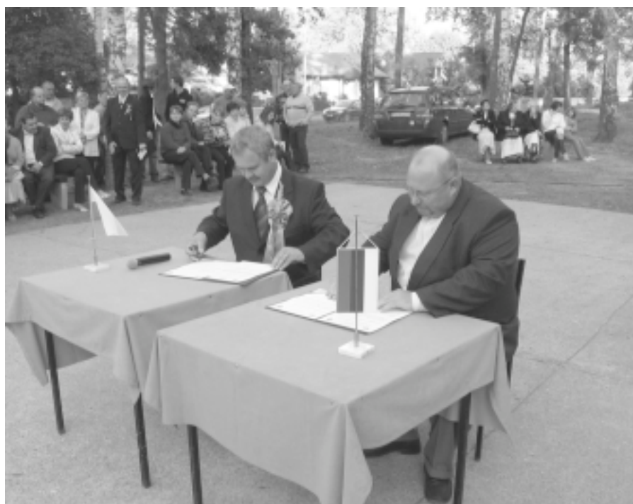
Koostööleping Duszniki ja Illuka valla vahel sai allkirjadega kinnitatud.

Võõrustajate poolt oli kokku pandud tihe ja huvitav programm, mis andis hea ülevaate valla arengust ja edasistest koostöövõimalustest. Meelikõitev oli Grzebienisko Gümnaasiumi ja Põhikooli õpilaste tervituskontsert, mis tõi kohe meelde meie tublid laulutüdrukud Illuka Põhikoolist ja tekitas kohalolnutes ideid võimalikust muusikaalasest koostööst